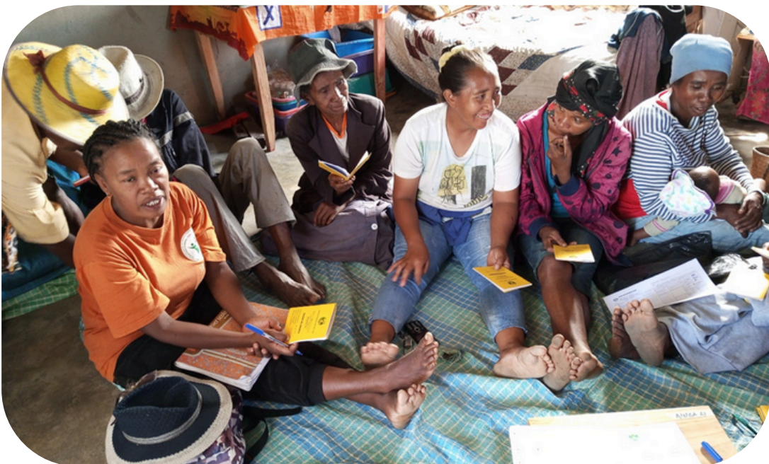
Distribution des carnets de comptes avant l'achat des parts - Ambohidray AINGA