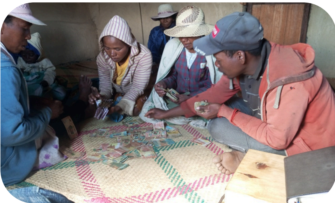
Billetage de l'argent collecté lors de la réunion à Loharano