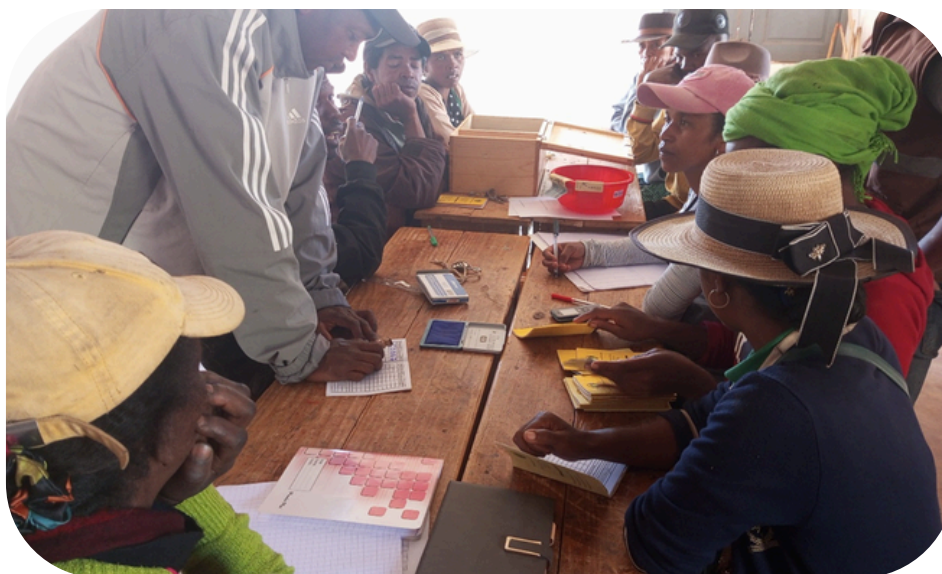
Réunion d'achat des parts et de prêts - Andina