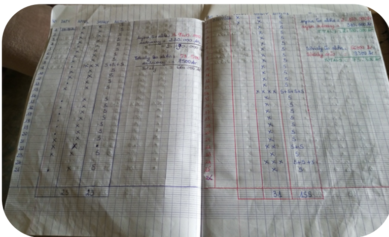
Cahier d'enregistrement des épargnes et de la caisse sociale - Ambohidray

Épargne hebdomadaire : Les membres achètent des parts lors de réunions hebdomadaires. Chaque membre peut acheter entre 1 et 5 parts à chaque réunion, en fonction de ses moyens.